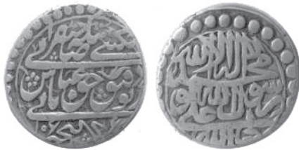
تصویر شماره ۱: سکه نقره شاه عباس دوم (فرح‌بخش، ۱۳۵۴: ۳۳).

برخی از حروف جلب توجه می‌کنند که به صورت کشیده نوشته شده‌اند، مانند حرف ی «ثانی» و «صاحبقرانی» و واژه‌های دیگری که بر روی این خط کشیده قرار گرفته‌اند، پس می‌توان گفت این نوع ترکیب‌بندی واژه‌ها، شاخص‌ترین ویژگی سکه شاه عباس دوم بوده که بعدها مورد تقلید دیگر سلاطین قرار گرفته است.