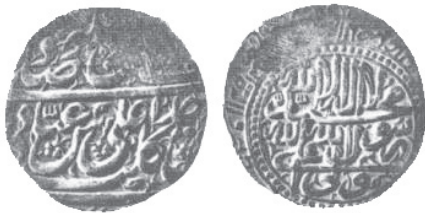
تصویر شماره ۲: سکه نقره شاه عباس دوم (فرح‌بخش، ۱۳۵۴: ۳۴).

از دیگر ویژگی‌ها می‌توان به این مورد اشاره کرد که اگر چه متن حک شده روی هر سکه یکسان است، اما در میان دو حرف کشیده تغییراتی در ترکیب‌بندی ایجاد شده است، حرف کشیده سطر پایین بر روی این سکه، حرف «ب» واژه «کلب» و کشیدن حرف «ب» به جای کشیدن حرف «ی» صاحبقرانی برگزیده شده و «نی» صاحبقرانی در کنار «عباس» قرار گرفته است (حسینی و قاضی‌زاده، ۱۳۹۵: ۹).