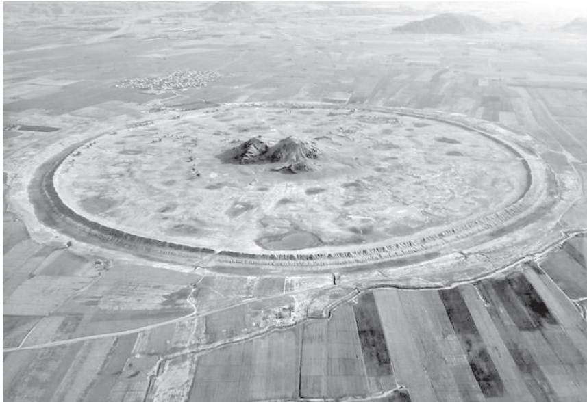
تصویر شماره ۴. شهر مدور دارابگرد با خندقی عمیق

شهر دو دروازه اصلی و دو دروازه فرعی داشته و به نظر می رسد در دوره ساسانیان دروازه شمالی مدخل اصلی شهر بوده است، چرا که نسبت به سایر دروازه ها عریض تر و خیابان اصلی آن منتهی به