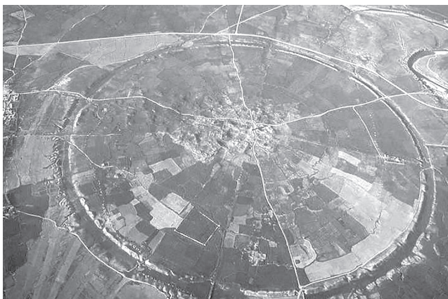
تصویر شماره ۳. نمای دایره‌ای شکل اردشیرخوره (همان).

نقشه دایره‌ای شکل اردشیرخوره (تصویر شماره ۳) از فرهنگ پارتی اقتباس شده که تا آغاز دوره ساسانی هنوز وجود داشته است (کیانی، ۱۳۶۵: ۱۸۰).