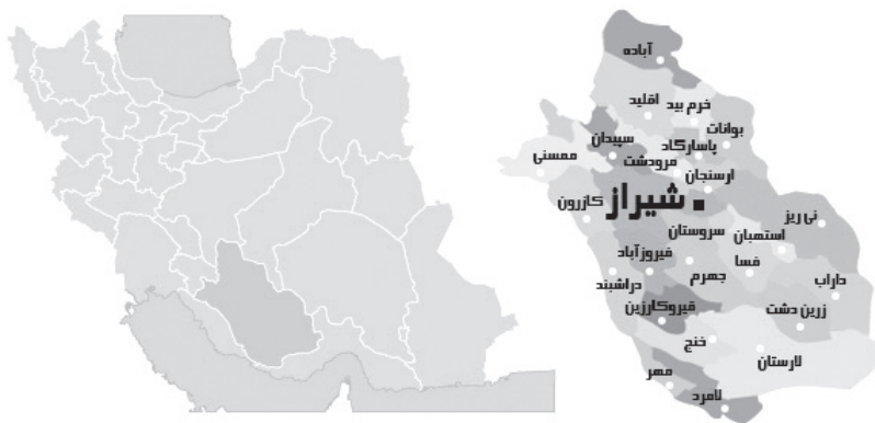
تصویر شماره ۲. نقشه موقعیت جغرافیایی استان فارس و شهر اردشیرخوره، فیروزآباد

وجود قلعه دختر در میان کوه‌های مرتفع و صعب‌العبور که بر معبر اصلی مسلط بوده تأیید می‌کند. این شهر و نقشه آن در دوره‌های بعد در ساخت شهرهای دارابگرد و همچنین به صورت بسیار قوی در ساخت شهر مد نظر خلیفه منصور عباسی بوده است (کیانی، ۱۳۶۵: ۱۸۱). این مسیر یک راه ایده‌آل برای دفاع و لشکرکشی پیروزمندانه اردشیر بوده است.